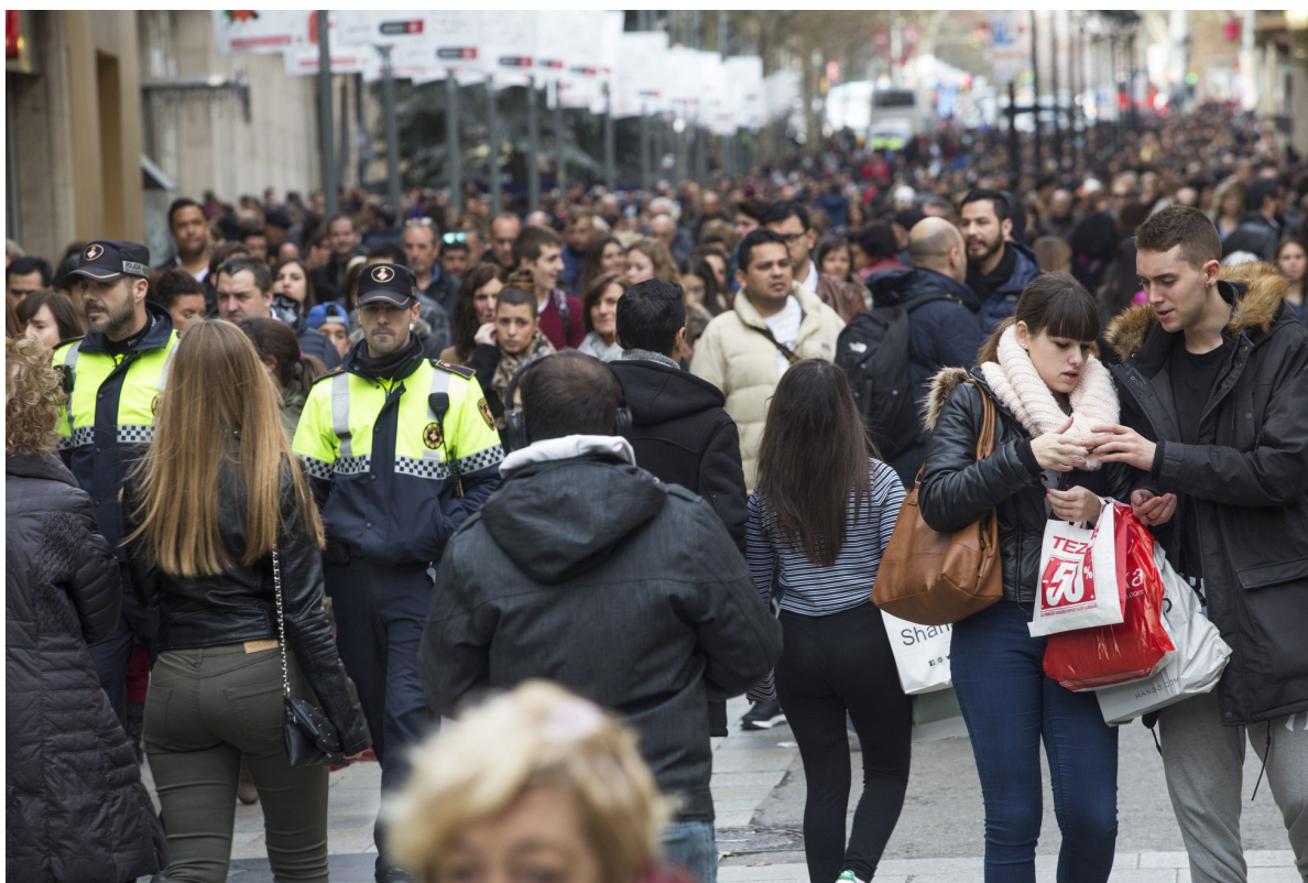
La calle Portal del Àngel, el pasado 7 de enero, durante el inicio oficial de las rebajas de invierno

Las asociaciones que aglutinan a los comercios del centro de Barcelona quieren más domingos de libertad de apertura y horarios que vayan más allá de las seis de la tarde. Así reaccionaron ayer a la propuesta del Ayuntamiento de Barcelona, que plantea eliminar los diez domingos que actualmente permite abrir en verano y limitarlos a cuatro en mayo y septiembre. En una reunión del sector con los representantes del Consistorio, responsables de Barna Centre (los comercios del Casco Antiguo) y de Born Comerç reivindicaron "la libertad de apertura a cada comerciante", una posición muy alejada a la del ejecutivo de Barcelona en Comú, que aseguró que buscará consenso porque "si un tema necesita un pacto de ciudad es este".