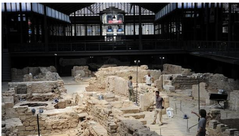
El yacimiento del Born, poco antes de la inauguración del centro en 2013

ANNA CABEZABarcelona - 01/02/2016 a las 10:43:59h. - Act. a las 10:44:55h.