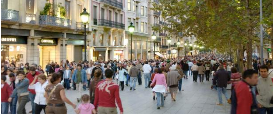
El Portal de l'Àngel de Barcelona, uno de los ejes comerciales más importantes de Barcelona, Cataluña y España. (AJUNTAMENT DE BARCELONA)