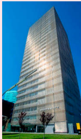
La sede de la empresa.