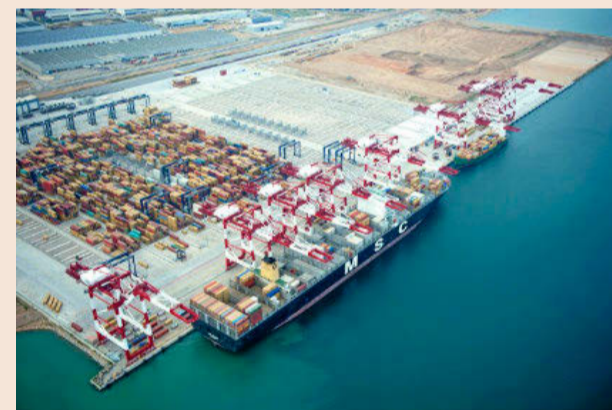
Las grúas de la Terminal Best, en el Puerto de Barcelona.

■ La filial del grupo chino Hutchison reclama que se aceleren los accesos ferroviarios, que no culminarán hasta 2018