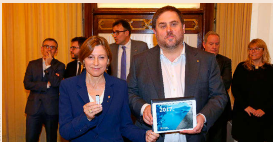
El vicepresidente Oriol Junqueras entrega las cuentas a la presidenta del Parlament, Carme Forcadell.

Más gasto en política social, un incremento del empleo público y una subida de la presión fiscal. Son algunas de las bazas que incluye el proyecto de Presupuestos para 2017 que ayer presentó en el Parlament el vicepresidente de la Generalitat y conseller de Economia i Hisenda, Oriol Junqueras. El gasto en obra pública alcanzará los niveles de 2013, pero aún muy lejos del récord histórico de 2009. La entidad pública cuya asignación presupuestaria subirá más será la Agència Tributària de Catalunya (ATC). P5-6