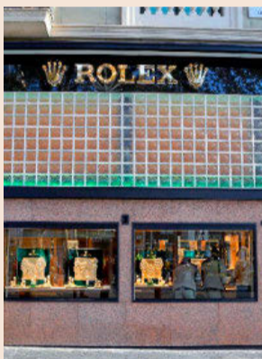
La nueva tienda de Rolex.

Joan Elias y Màrius Rubiralta se disputan el rectorado de la UB P7