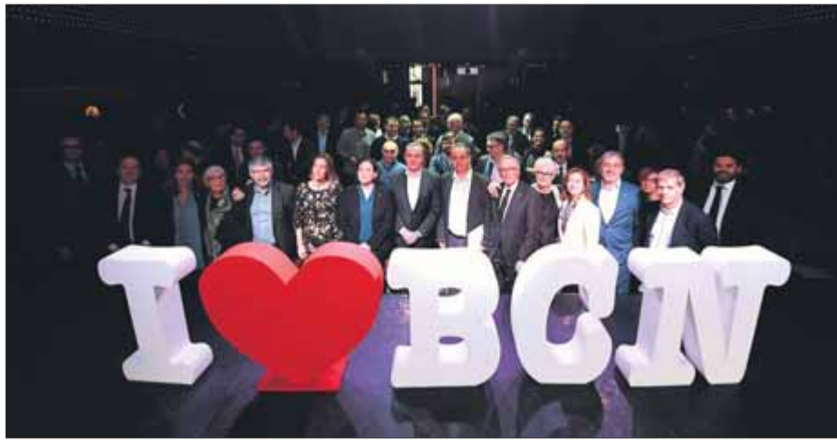
Barcelona Oberta creu que la ciutat "ha d'aspirar a ser el millor lloc on viure i invertir"